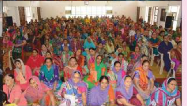
श्री स्वामिनारायण मंदिर कालुपुर द्वारा प.पू. आचार्य महाराजश्री की आज्ञा से आयोजित ऋषिकेश में श्रीमद् भागवत सप्ताह पारायण