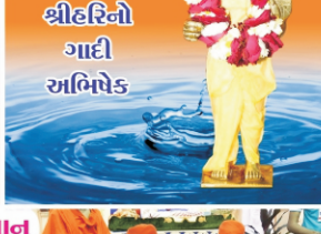
શ્રીહરિનો ગાદી અભિષેક