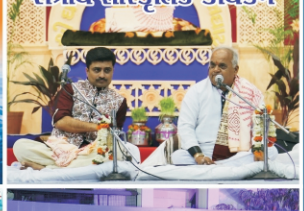
રાષ્ટ્રીય સૌસ્કૃતિક કાર્યક્રમ