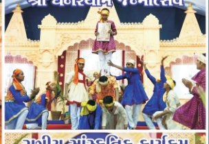
શ્રી ઘનશ્યામ જન્મોત્સવ