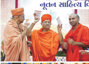
નૂતન સાહિત્ય વિમોચન તથા યજમાન સન્માન