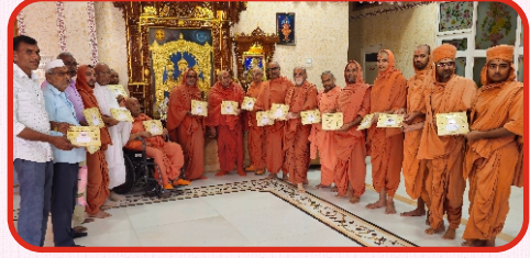
શ્રીહરિ તપોવન ગુરુકુળ ગંગાજી રામપર - વેકરાના ૨૫ વર્ષ ઉપક્રમે આયોજિત સંસ્કાર પર્વ મહોત્સવનું આમંત્રણ આપતા મંડળના અધ્યક્ષ તથા સંચાલક સંતો સાથે મંડળના સંતો તથા સમિતિ સભ્યો - ભુજ