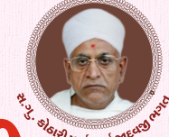
પ.પ. શ્રી સ્વામિનારાયણ મંદિર