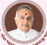
પ.પ. શ્રી સ્વામિનારાયણ મંદિર