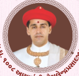
પ.પ. શ્રી સ્વામિનારાયણ મંદિર