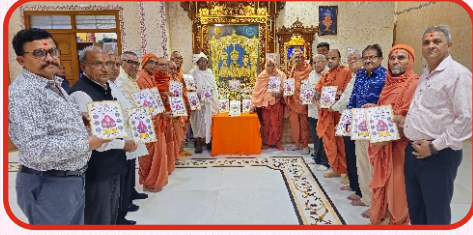
ભુજ મંદિર સંચાલિત શ્રી સ્વામિનારાયણ સત્સંગ ભવન - નડિયાદના દશાબ્દી મહોત્સવની પત્રિકા અર્પણ કરતા સત્સંગ ભવન સંચાલન સમિતિ તથા યજમાનો - ભુજ