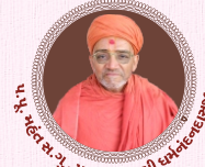
પ.પ. શ્રી સ્વામિનારાયણ મંદિર