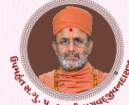
પ.પ. શ્રી સ્વામિનારાયણ મંદિર