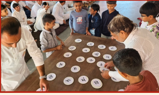
રહી. ધાર્મિક શિક્ષણ, મનોરંજન અને સત્સંગનો