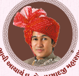
પ.પ. શ્રી સ્વામિનારાયણ મંદિર